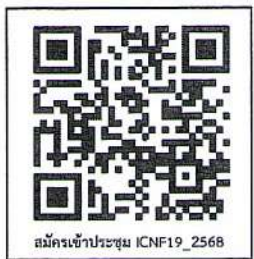
สมัครเข้าประชุม ICNF19_2568

จึงเรียนมาเพื่อโปรดพิจารณาประชาสัมพันธ์และอนุมัติให้ข้าราชการหรือบุคลากรในสังกัดของ ท่านเข้าร่วมประชุมตามวัน เวลา และสถานที่ดังกล่าว จะเป็นพระคุณ